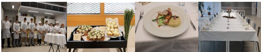
Zaključni izpit 2023, GH3 in Poklicna matura 2023, GT2, april 2023

Veliko projektov bo tudi medijsko podprtih, zato se boste lahko preizkusili tudi pred kamerami. Poročila o dogodkih boste predstavili na spletni strani šole, v promocijskih oddajah na TV in v lokalnem tisku. Seveda pa ne bo manjkalo zabavnih in razvedrilnih dogodkov (novoletna zabava) ter poučnih vsebin (ogled čistilne naprave, kino predstave, predavanja, proslave). Poleg rednega pouka pa boste dijaki vseh letnikov gostinstva pridobivali neprecenljive praktične izkušnje pri pripravi samostojnih pogostitev v šoli in izven šole v lokalnem okolju.