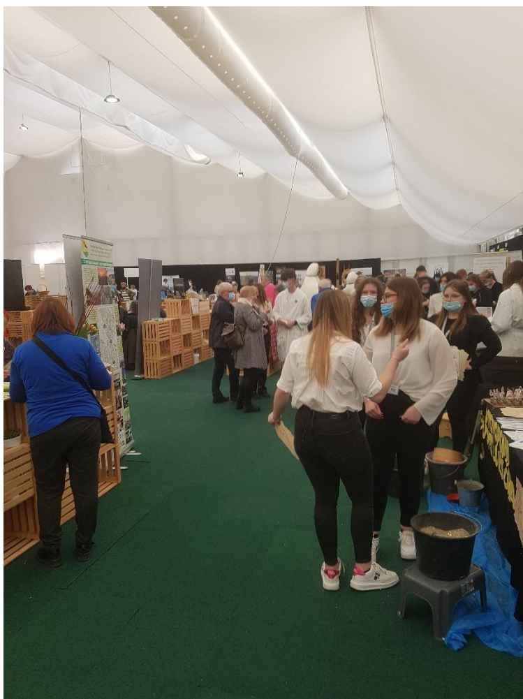
6. Slika; Delo se je začelo.