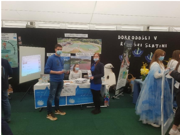
10. Slika; Čas za odmor in premislek