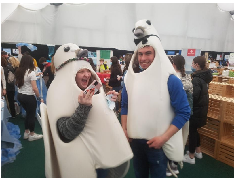
5. Slika; Malo po dvorani, tudi drugi delajo.