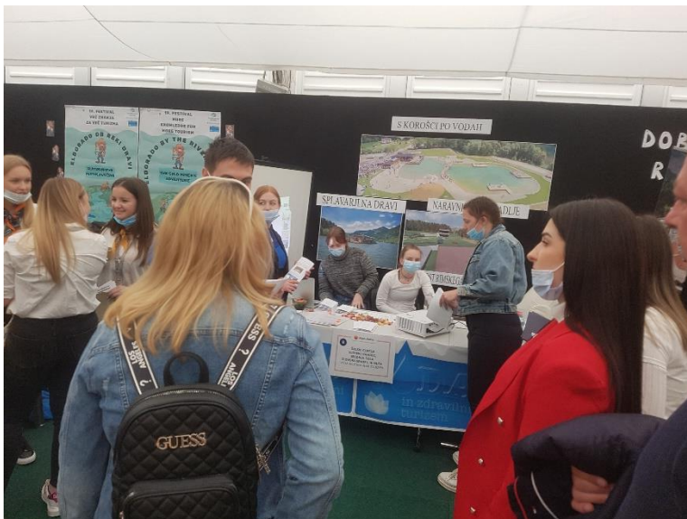
9. Slika; V pričakovanju novih gostov