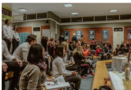
Slika 5: Obisk staršev na prireditvi