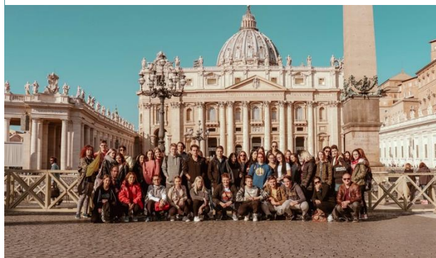
Slika 1: Skupinska fotografija dijakov GTT

ekskurzije v glavno mesto Italije Rim in Neapelj.