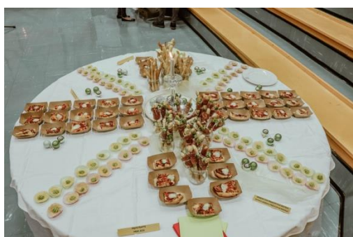
Slika 4: Delo dijakov GTT3/4

voden program, hkrati pa izdali še bilten z našimi predstavitvami znamenitosti Rima in Neaplja.