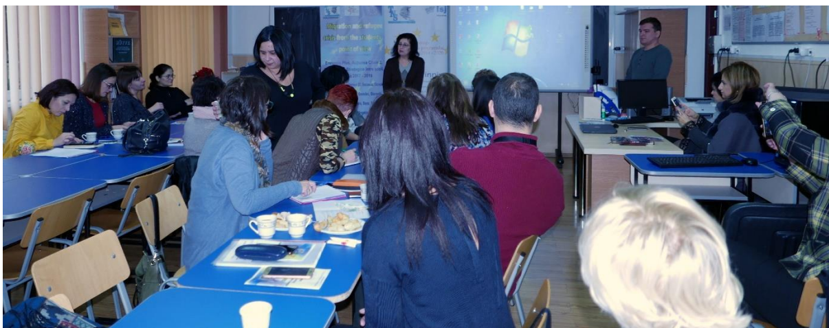
Na srečanju učiteljev regije Prahova v okviru projektov eTwinning, smo predstavili eTwinning platformo našega projekta.