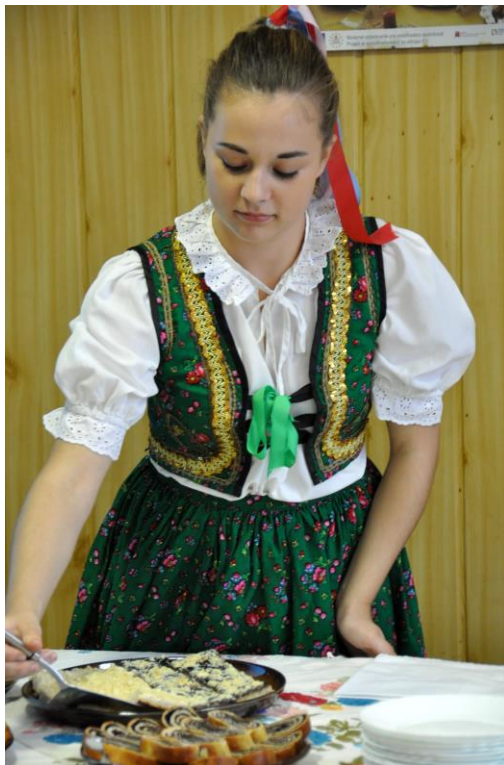
V zelo lepih narodnih nošah so nam predstavili svoje tradicionalne jedi.