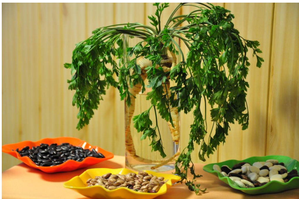
Ogledali smo si razstavo darov jeseni.