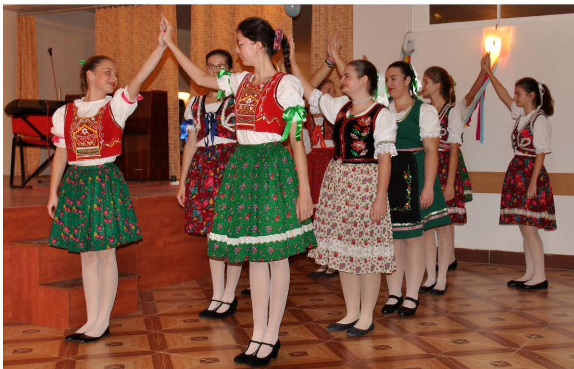
Dijaki šole so nam predstavili tradicionalne slovaške plesе.