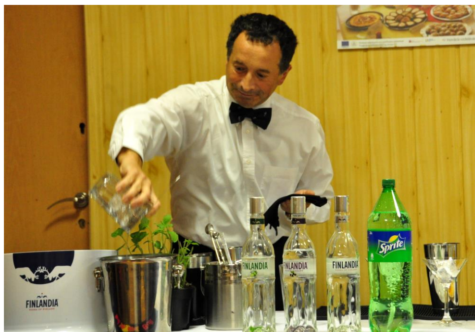
Doživeli smo tudi profesionalno predstavitev mešanja hladnih pijač.