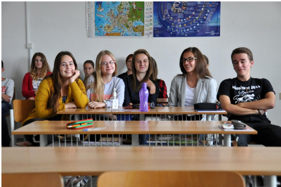
Med poukom smo zmotili dijake šole, s katerimi smo se zapletli v prijeten pogovor. Predstavili so nam Slovaško in pripovedovali o sebi, zanimalo pa jih je vse o nas.

V času od 4. do 9. oktobra smo se učitelji vseh partnerskih držav izobraževali na slovaški šoli, z imenom Spojená Škola Kollárova . Pridobivali smo znanja o uporabi portala e-twinning in pripravljali dokumentacijo za standardizirani dokument Europass Mobilty. V času srečanja pa so na šoli potekale številne aktivnosti, s katerimi so dijaki in učitelji predstavili svoje delo v projektu, kakor tudi svojo šolo.