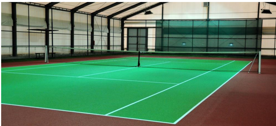
Občudovali smo njihovo obnovljeno pokrito tenis igrišče.