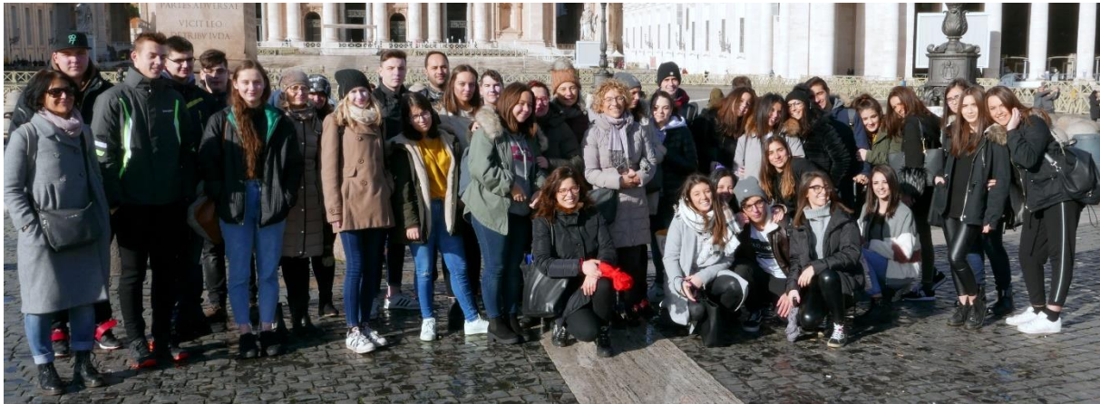
Na ogledu Rima.