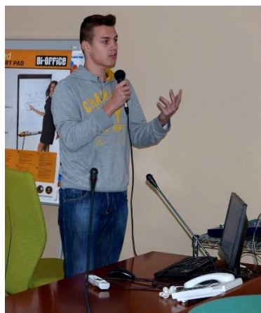
Matic med predstavitvijo intervjuja, ki ga je že pred srečanjem opravil z dvema beguncema iz Sirije.