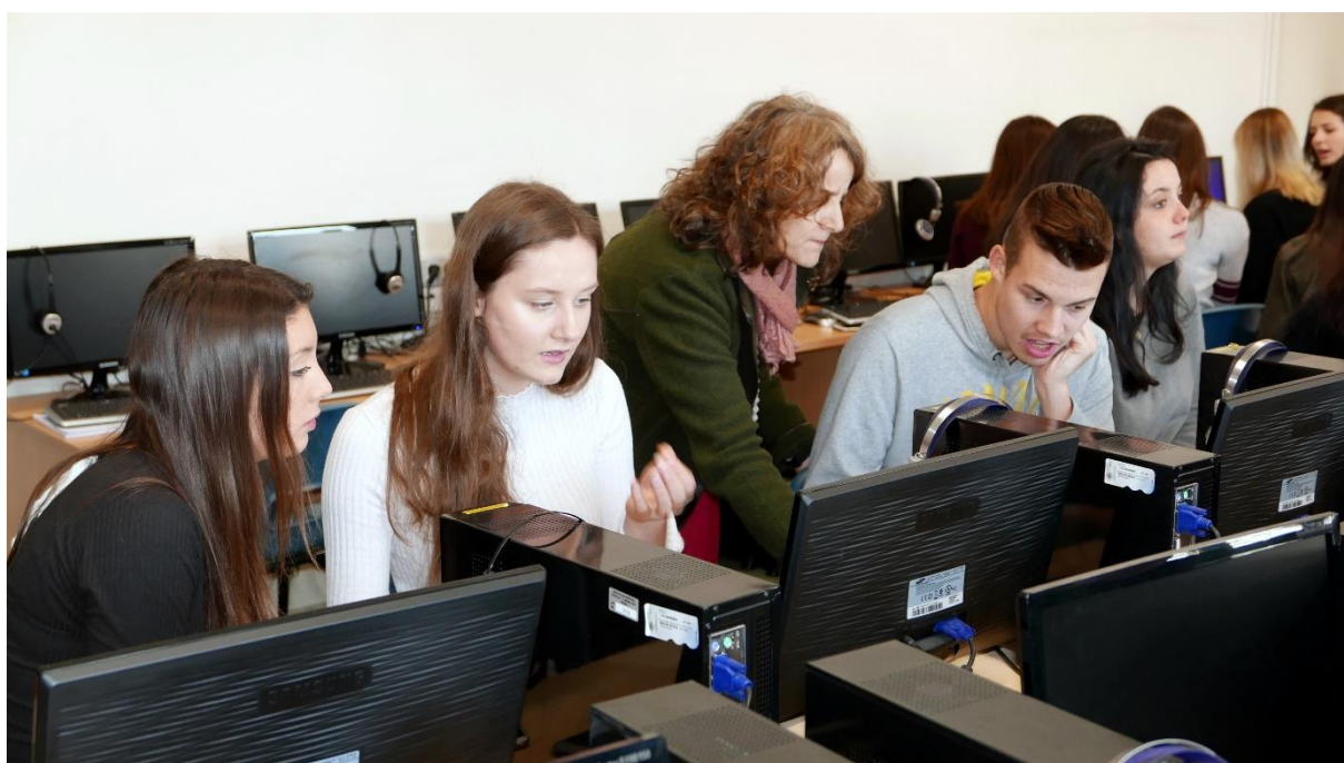
Matic in Špela med delavnico, na kateri so dijaki primerjali status beguncev v posameznih državah.