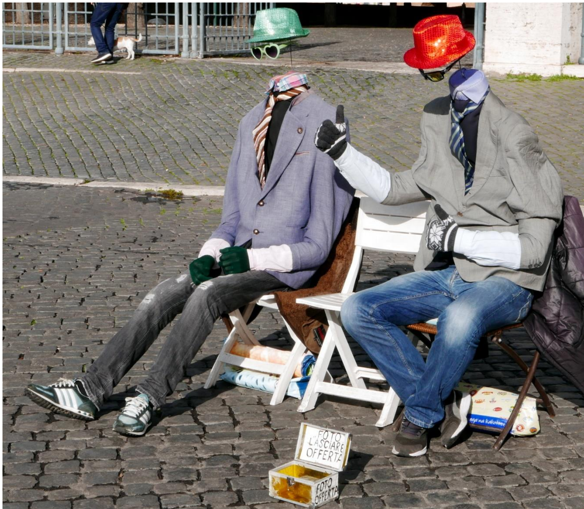
Takile prizori niso nič nenavadnega na rimskih ulicah.