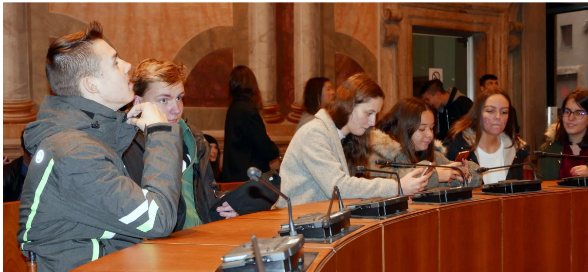
Na sprejemu v mestni hiši v Terniju.