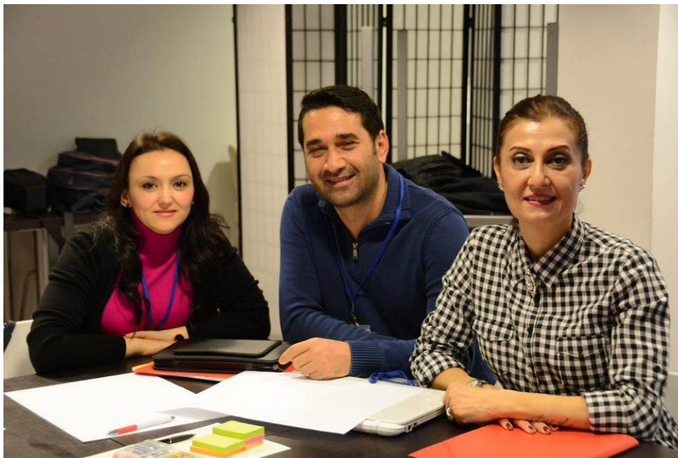
Učitelji iz turškega mesta Adana.