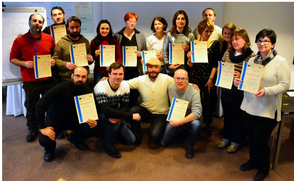
Učitelji vseh sodelujočih šol smo prejeli potrdila o izobraževanju.