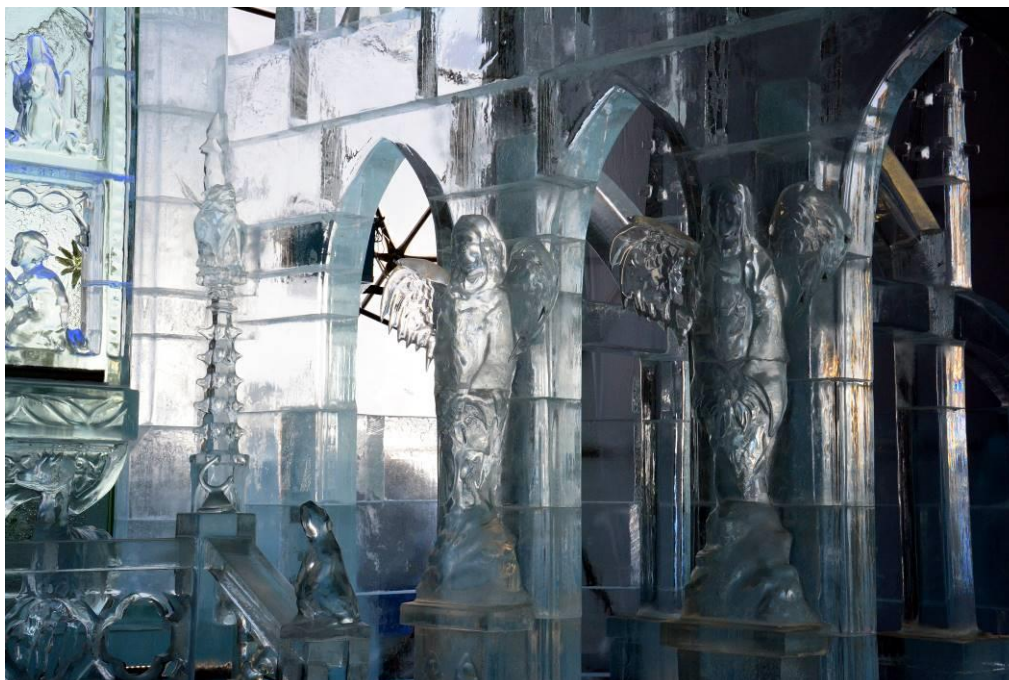
V Visokih Tatrah smo si ogledali razstavo umetnin iz ledu.