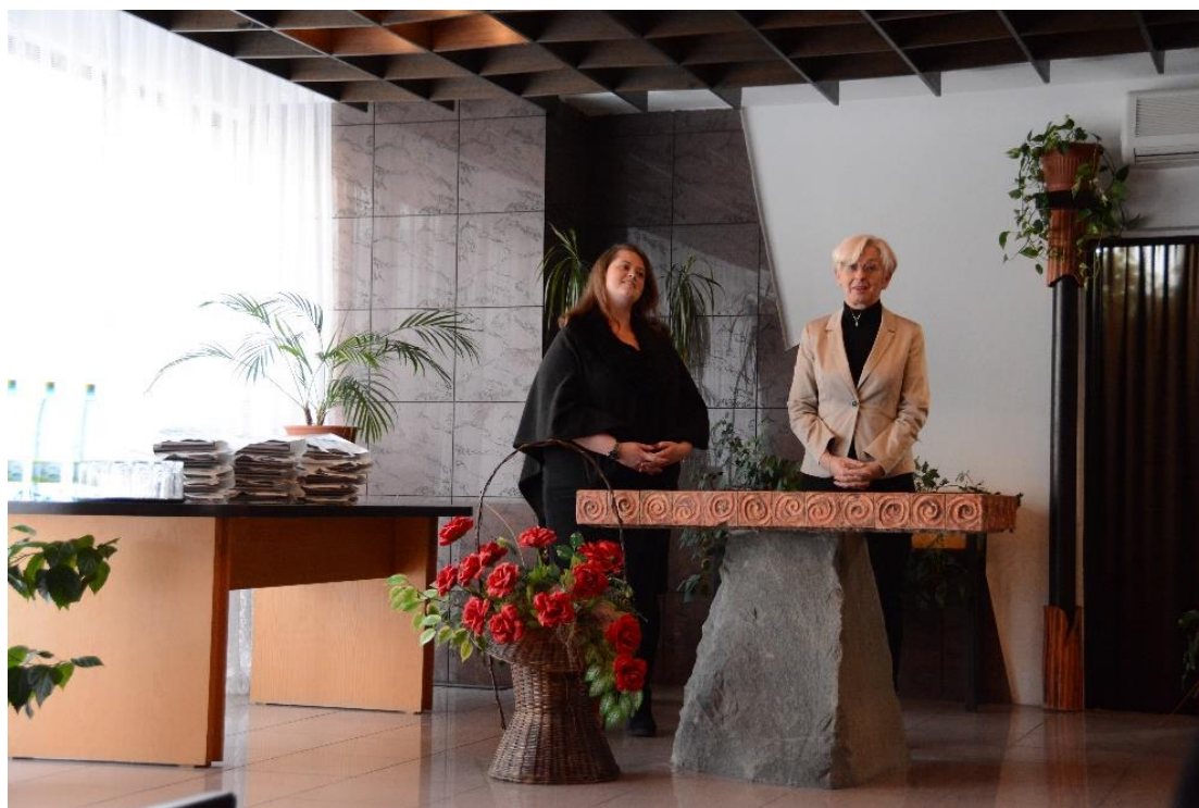
Med sprejemom na občini Sečovce.

Učitelji vseh petih sodelujočih šol smo v okviru Erasmus+ projekta Družbeni mediji v izobraževanju preživeli teden dni v času od 22. 1. do 29. 1. 2017 na Slovaškem, na srednji šoli iz mesta Sečovce.